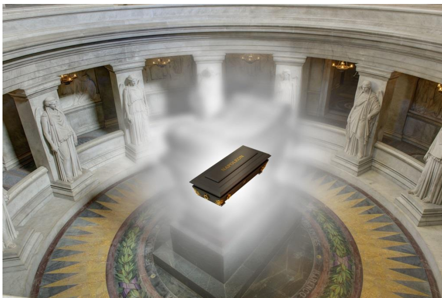
Captures d'écran de la tablette Dôme interactive : le cercueil en ébène du tombeau de l'Empereur

Les autres tombeaux et monuments funéraires sont également présentés : Joseph Bonaparte, le frère aîné de l'Empereur, Turenne, Vauban, spécialiste des fortifications au service du Roi-Soleil, mais également les maréchaux Foch et Lyautey.