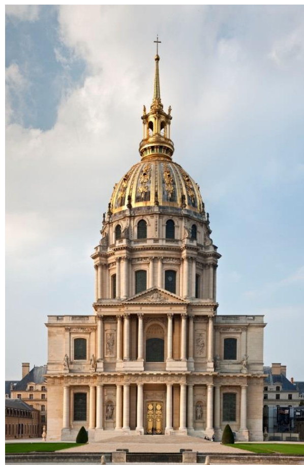
Le Dôme des Invalides

A l'intérieur, la grande excavation centrale, où se trouve le tombeau de Napoléon I er , est postérieure à la construction de l'édifice. La décision d'édifier ce tombeau aux Invalides fut en effet prise en 1840 par le roi Louis-Philippe I er , qui a fait de l'Hôtel des Invalides un lieu emblématique du souvenir de l'Empereur, où sont désormais inhumés plusieurs membres de la famille Bonaparte, rejoints au XX e siècle par les maréchaux Foch et Lyautey.