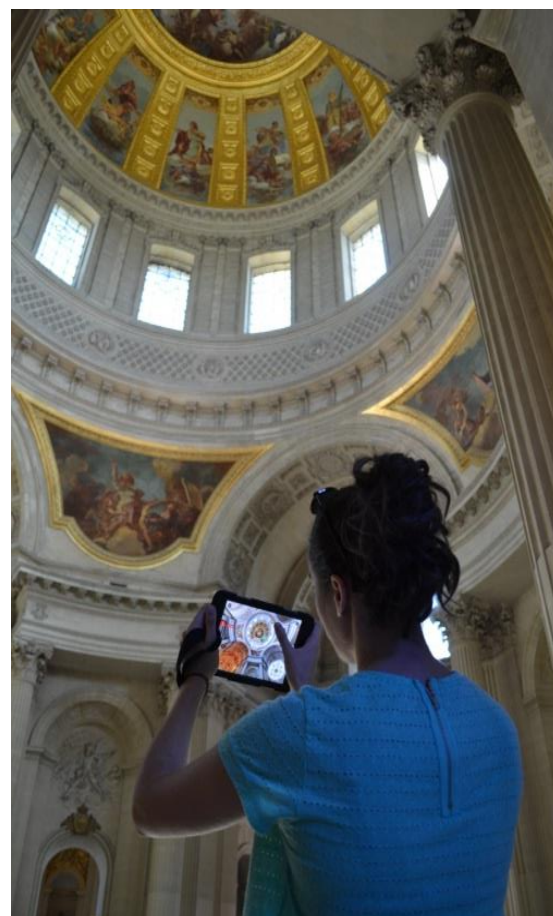
La tablette Dôme interactive

La chapelle Saint-Jérôme est reconstituée dans ce programme telle qu'elle fut aménagée en 1840 pour accueillir le cercueil de l'Empereur, jusqu'à l'inauguration du tombeau en 1861. Des commentaires expliquent le voyage du retour des Cendres de Sainte-Hélène et les principales œuvres civiles du gouvernement de Napoléon, évoqués par les bas-reliefs, ainsi que les victoires napoléoniennes inscrites sur le pavement central.